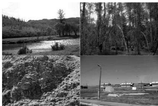
Зураг 2. Шатан орчмын шувуудын амьдрах орчин.

Хээрийн судалгаанд түгээмэл ашиглагддаг ажиглах, бүртгэх, маршрутын аргыг хэрэглэн дээж материал цуглуулсан. Хээрийн ажиглалтанд бид хоёр нүдний дуран, телескоп, GPS, хонгил нүхний доторхийг шалгадаг уян дуран, шувууны өнгөт зураг бүхий гарын авлага, зургийн аппарат хэрэглэсэн.