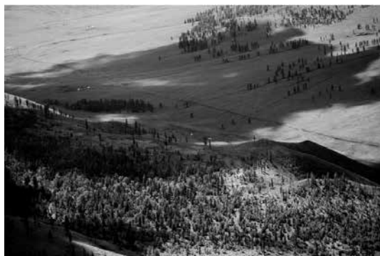
Зураг 1. Шатангийн амны ерөнхий байдал

орших 1628 м өндөртэй Цогт-Өндөр уул, нам цэг нь Шатангийн голын хараа гол руу цутгаж буй адагт 1200 м өндөртэй байна. Нутгийн ихэнх хэсгийн уулын араар холимог болон хусан ой, харин Хараа, Өлгий, Шатан голын дагуу татмын нуга, голын хөндийтэй. Уул хоорондын хөндийд алаг өвс, хялганат болон уулалж алаг өвст ургамлын хэв шинж холилдон зонхилно. Бидний судалгааны талбай нь Хан Хэнтийн дархан газрын орчны бүсэд багтах учир тэнд ховор элдэв зүйл хөхтөн, шувууд тархан амьдрах нь элбэг байдаг (Зураг 1). Энэ нутагт газар тариалан төдийлөн эрхэлдэггүй ба өрхийн хэмжээний жижиг газар тариалан эрхэлж, төмс, байцаа, лууван гэх мэт хүнсний ногоо ихэвчилэн тариална, харин уул уурхайн үйл ажиллагааны нөлөөнд өртөөгүй ба Орос Монголыг холбосон төмөр замын засварын үйл ажиллагаанд зориулж уулын хормой, бэлээс шороо, хайрга олборлосон үл мөрүүд