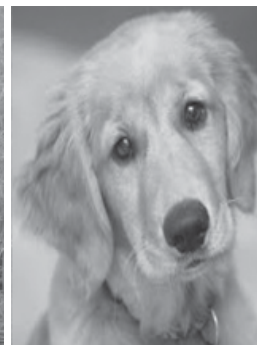
Голдонретвидер - 1