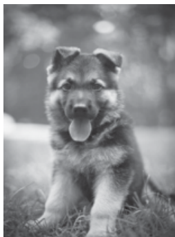
Овчарка – 12