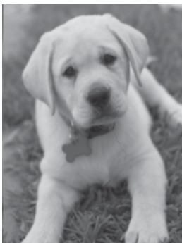
Лабратори – 7