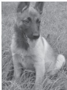
Малинуа – 7