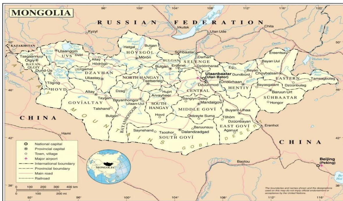
Зураг 1. Монгол Улсын газрын зураг

Монгол Улсад хүүхдийн сургуульд хамрагдалтын түвшин өндөр, тодруулбал хөвгүүдийн 95 хувь харин охидын 97 хувь нь бага болон дунд сургуульд хамрагддаг. Харин казах хөвгүүдийн сургуульд хамрагдалтын хувь мэдэгдэхүйц бага 91 хувь байна 20 . Арван нэгэн настайдаа бага ангиас дунд ангид шилжсэн сурагчдын хувь мөн өндөр, дундажаар 97.3 хувь байна 21 . Гэхдээ хүүхдийн гэр бүлийн эдийн засгийн нөхцөл байдлаас хамаарч орлогын түвшин хамгийн бага хорин хувьд багтах өрхийн хүүхдүүдийн 75 хувь, харин орлогын түвшин хамгийн өндөр хорин хувьд багтах өрхийн хүүхдүүдийн 98.7 хувь нь бүрэн бус дунд сургуулийн дүүргэж байна 22 . Харин бүрэн дунд сургууль дүүргэсэн эрэгтэй сурагчдын хувьд энэ ялгаа маш тод илэрч, хамгийн бага орлоготой хорин хувьд багтах өрхийн эрэгтэй хүүхдүүдийн 51.3 хувь нь, харин хамгийн их орлоготой хорин хувьд багтах өрхийн хөвгүүдийн 91.4 хувь нь бүрэн дунд сургууль дүүргэж байна. Охидуудын хувьд энэ ялгаа арай бага, хамгийн бага орлоготой хорин хувьд багтах өрхийн охидын 83.7 хувьд, хамгийн их орлоготой хорин хувьд багтах өрхийн охидын 90 хувьд бүрэн дунд сургуулиа дүүргэж байна 23 . Түүнээс гадна, сургуульд хамрагдалтын түвшин улс орны хэмжээнд